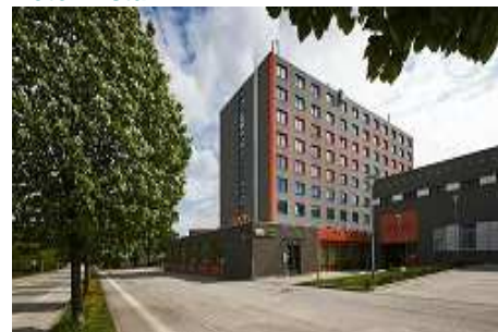
Hotel Vista ****