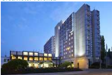
Orea Hotel Voroněž ****