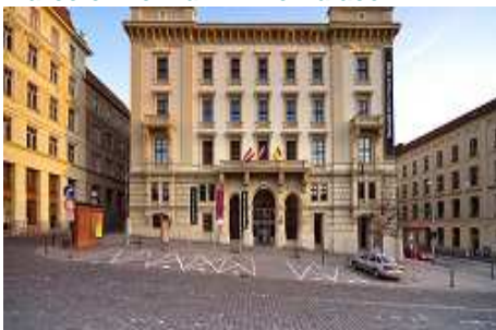
Barcelo Premium Brno Palace ****