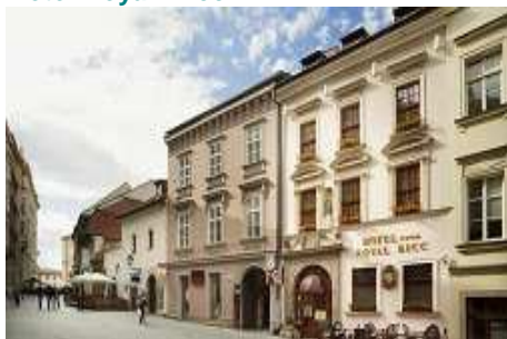
Hotel Royall Ricc ****

Nejčastěji uváděnou hodnotou v rámci našeho průzkumu brněnských hotelů byla obsazenost v rozmezí 31-35%, uvedlo 31% respondentů (3 hotely ve 3* standardu a 1 hotel ve 4* standardu), následně obsazenost v rozmezí 51-55% uvedlo 23% respondentů, 15% respondentů uvedlo obsazenost v rozmezí 41-45% a rovněž v rozmezí 56-60%, 7,7% respondentů uvedlo obsazenost rozmezí 61-65% a rovněž v rozmezí 66-70%.