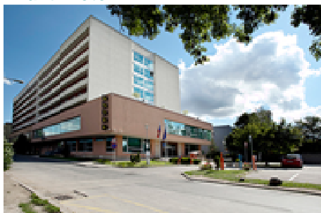
Avanti Hotel ****