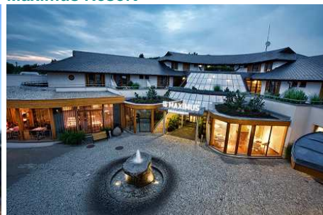
Maximus Resort ****