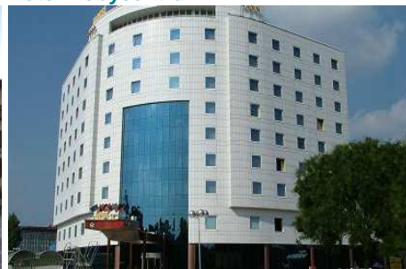
Hotel Bobycentrum ****