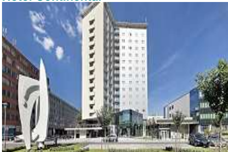
Hotel Continental ****