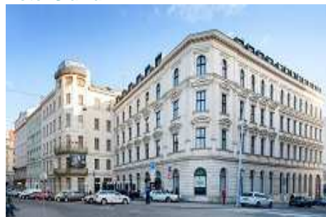
Hotel Slavia ****